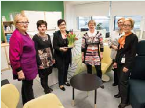
Diakoniatyöntekijöiden Liiton toimisto sai remontissa modernit työtilat ja raikkaan väriytyksen.