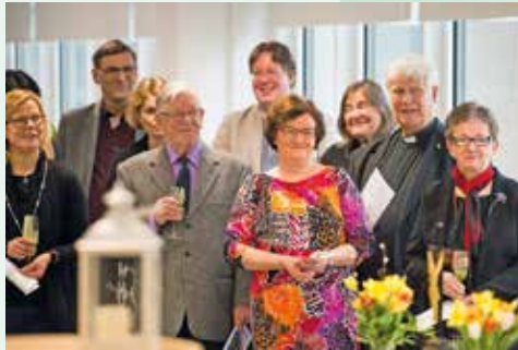
Kutsuvieraita saapui yli sata.