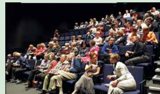
Kirkkopäivien ohjelmassa keskusteltiin diakoniaan liittyvistä myyteistä.